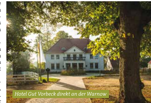
Hotel Gut Vorbeck direkt an der Warnow

Mehr Infos zu den Gutshäusern und Rundreisen von Schloss zu Schloss: www.mein-urlaub-im-schloss.de