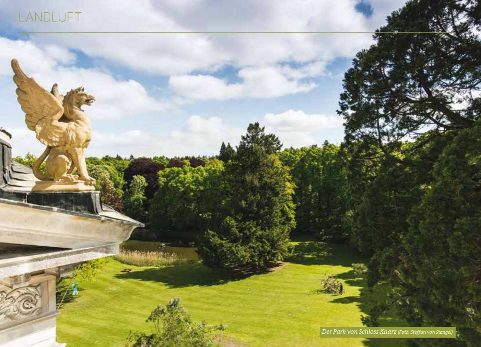
Der Park von Schloss Kaarz