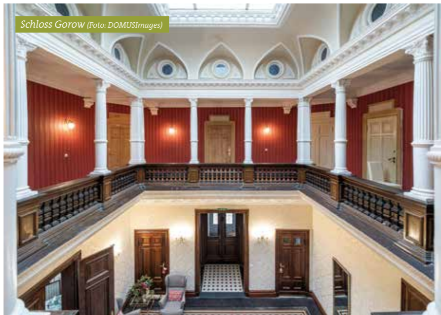
Schloss Gorow

mit Frühstück, Kartenmaterial zur Route und den Gepäcktransfer von Hotel zu Hotel. Preis 355,00 Euro pro Person im Doppelzimmer.