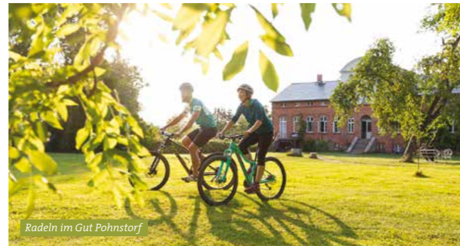
Radeln im Gut Pohnstorf