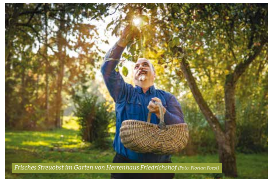
Frisches Streuobst im Garten von Herrenhaus Friedrichshof

Hier hat sich beginnend mit der Ostkolonisation im 12. Jahrhundert eine Kultur- und Naturlandschaft entwickelt, die einzigartig in Europa ist. Ende des 18. Jhd. war der großflächige adelige Gutsbetrieb bereits das bestimmende Element in der mecklenburgischen Landschaft.