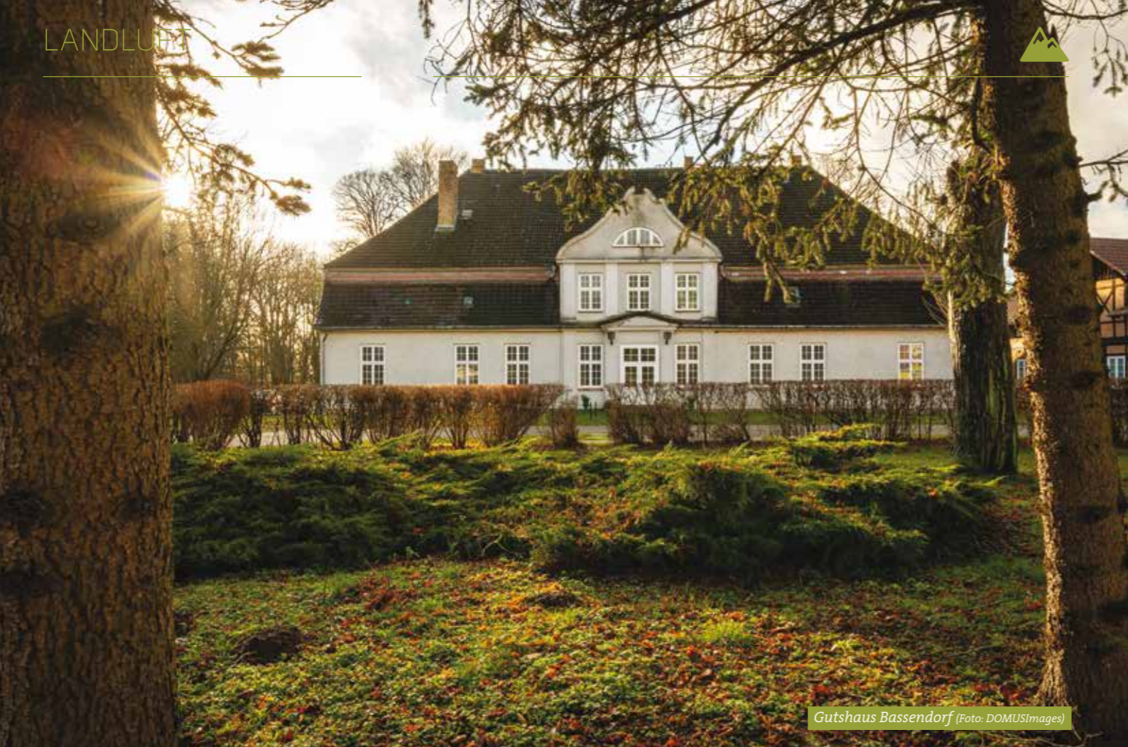
Gutshaus Bassendorf