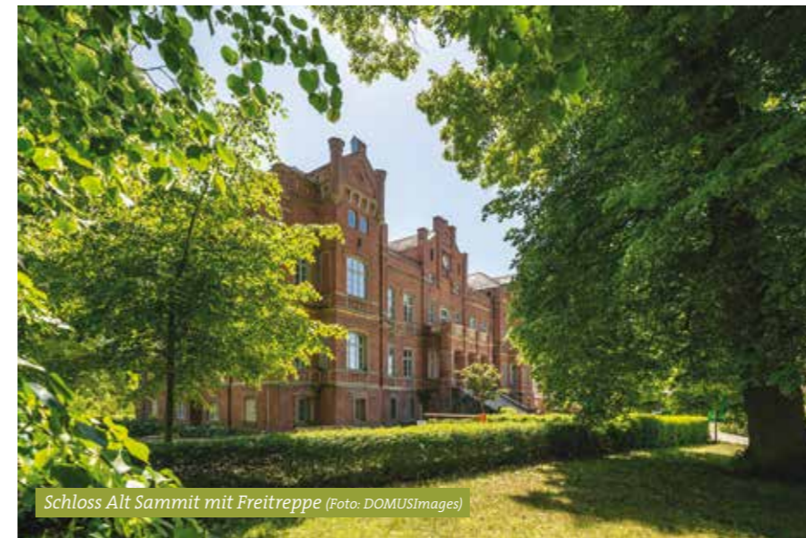
Schloss Alt Sammit mit Freitreppe