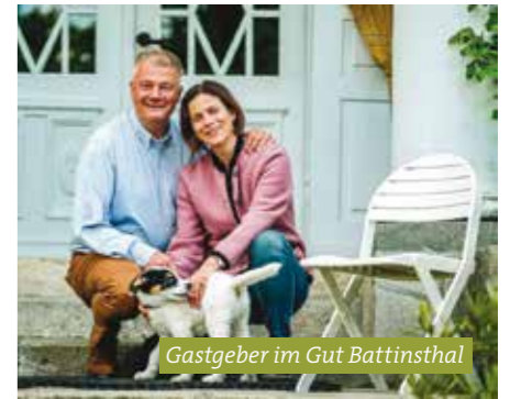
Gastgeber im Gut Battinsthal

Das Jagdschloss Kotelow ist umgeben von Weite und mit echten Antiquitäten ausgestattet. Im Salon und im Speisesaal wird ein Buffet mit hausgemachtem Kuchen aufgebaut. Auch nach Usedom ist es nicht mehr weit, hier lockt das Wasserschloss Mellenthin mit Schlossrestaurant, Brauerei, Brennerei und Kaffeerösterei. Im Schlosspark findet ein Töpfermarkt statt. Idyllisch an einem kleinen See liegen die Katen am Schwanenteich, die Überbleibsel einer ehemaligen Gutsanlage. Schlossgespräche, Fotokunst und Musik erleben die Gäste im spannenden Schlossgut Dargibell. Im Gut Rossin wird die Ausstellung „Lebensräume“ gezeigt und in Schlatkow wird ein kreatives Wohn-Konzept vorgestellt.